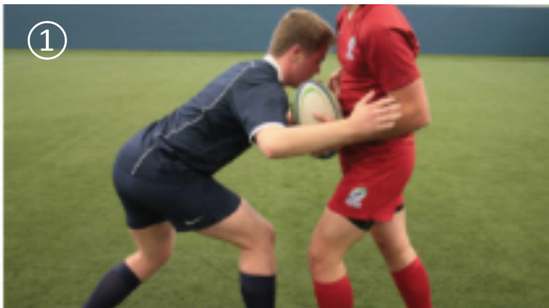
① 利き足をアタッカーの近くに置く