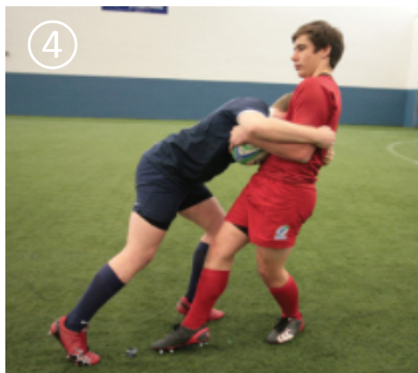
④ コンタクト後、ドライブで前進する