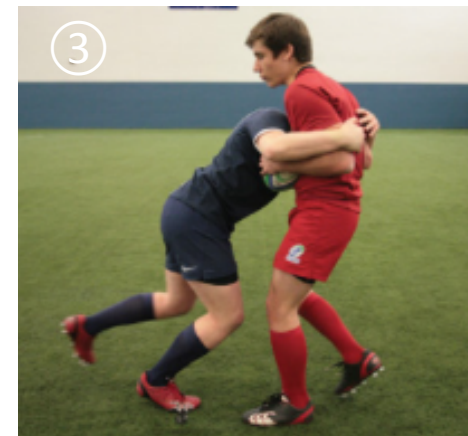
③ ボールキャリアを両手でかかえながら、ボールキャリアの両腕とボールを捕える