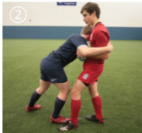
② 腰から胸の高さにあるボールを狙う