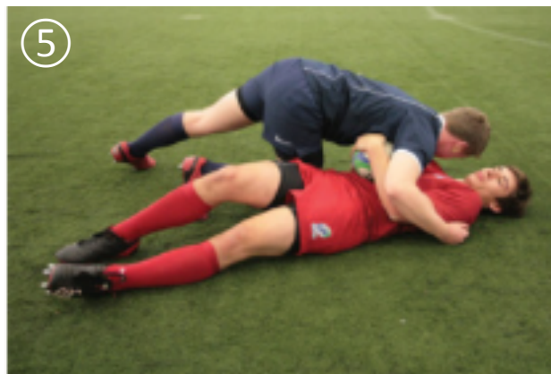
⑤ ボールキャリアを地面に倒す